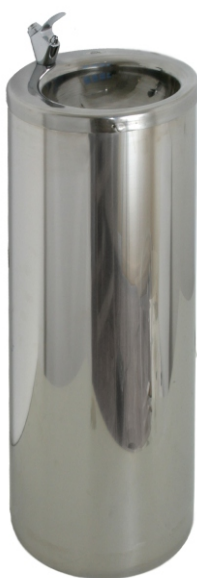
Zdrój wody pitnej nr kat. 1700 kolumna stal nierdzewna