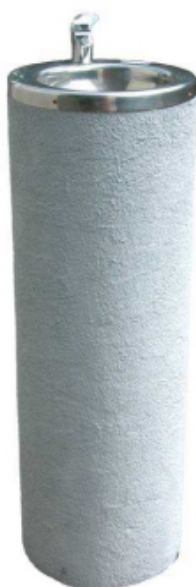
Zdrój wody pitnej nr kat. 1710 kolumna strukturalna